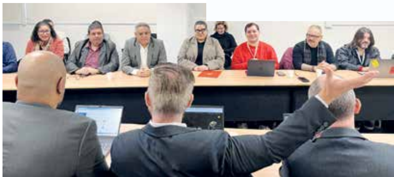
Representantes dos funcionários em negociação com o Banco do Brasil

A negociação terá continuidade nas próximas rodadas. A orientação do Sindicato é que a categoria acompanhe as informações pelos canais oficiais.