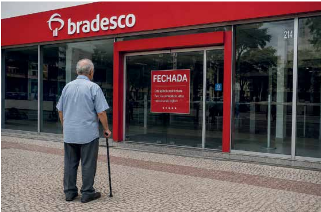
Os idosos estão entre os que mais sofrem com o fechamento das agências bancárias no país