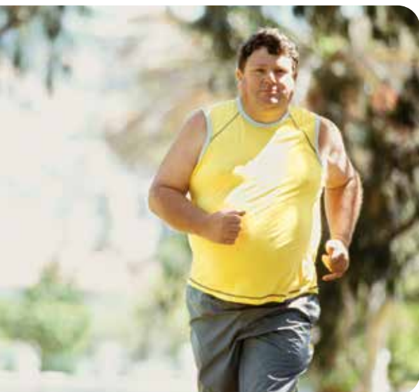
Corrida é uma boa pedida contra a obesidade

A OBESIDADE se tornou o principal fator de risco à saúde no Brasil, superando a hipertensão arterial, que liderava há década-