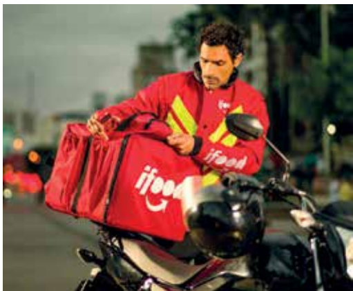
No Brasil, jornada é longa e os salários baixos

A IDEIA de que trabalhar mais significa sucesso voltou ao debate e não por acaso. Diante da rotina exaustiva de milhões de brasileiros, o governo federal lançou uma campanha que questiona essa lógica.