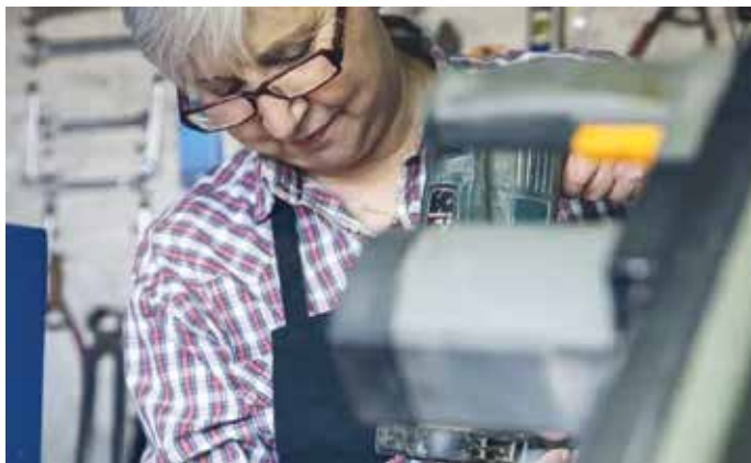
Sem poder se aposentar, idosos recorrem à informalidade

Atualmente, a Geração Prateada representa um quinto da população em idade ativa no país. Longe de ser uma livre escolha, a explosão de negócios comandados por