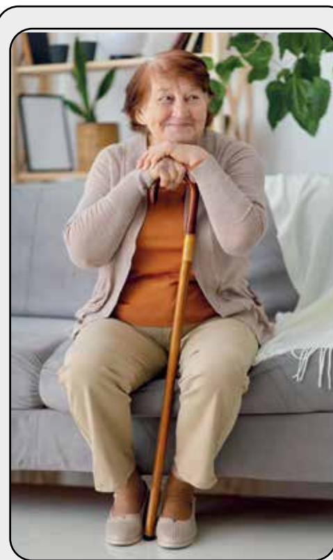
Brasil tem quase 35 milhões de idosos

As condições de trabalho do mercado de trabalho formal, marcado também pela etarismo, empurra essa parcela dos trabalhadores para a informalidade ou para a abertura de micronegócios de baixo rendimento.