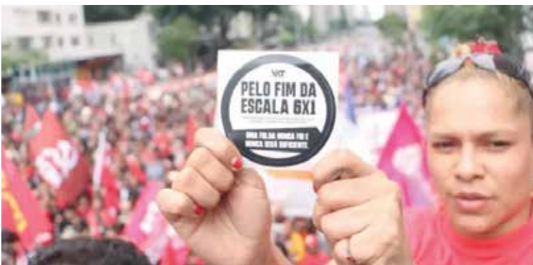
Fim da escala 6x1, uma necessidade para humanizar as relações de trabalho

Na prática, a exploração de 6 dias trabalhados consecutivamente e apenas um de folga está adoecendo a população. Daí a manutenção da luta da classe trabalhadora junto ao movimento sindical para pressionar o Congresso Nacional para aprovar à medida que acaba com a escala 6x1.