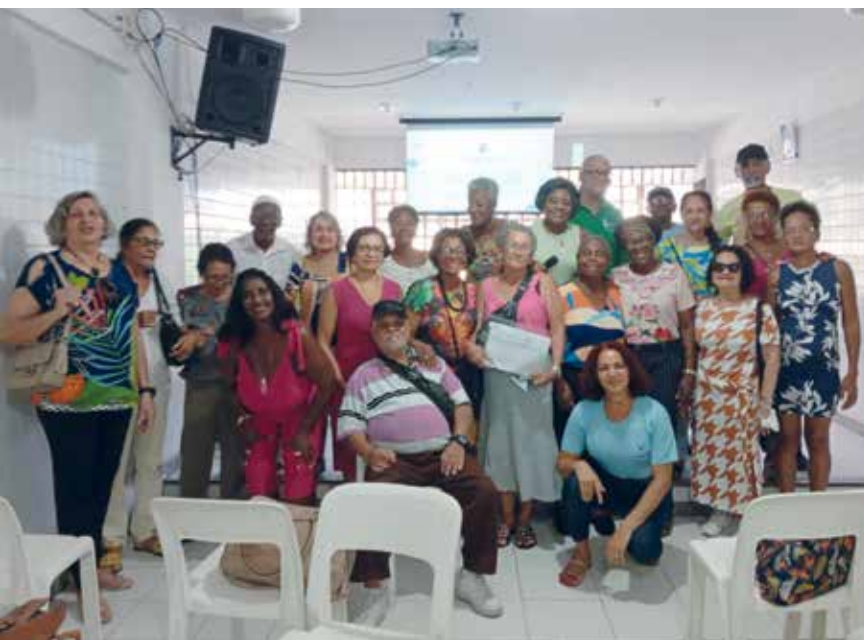
A nova composição do Fórum em Defesa da Pessoa Idosa da Bahia

Quanto ao saldo de vínculos, o Dieese mostra que o setor de informação, comunicação e atividades financeiras, mobiliárias, profissionais e administrativas registrou 384 mil admissões celetistas a mais do que o número de desligamentos.