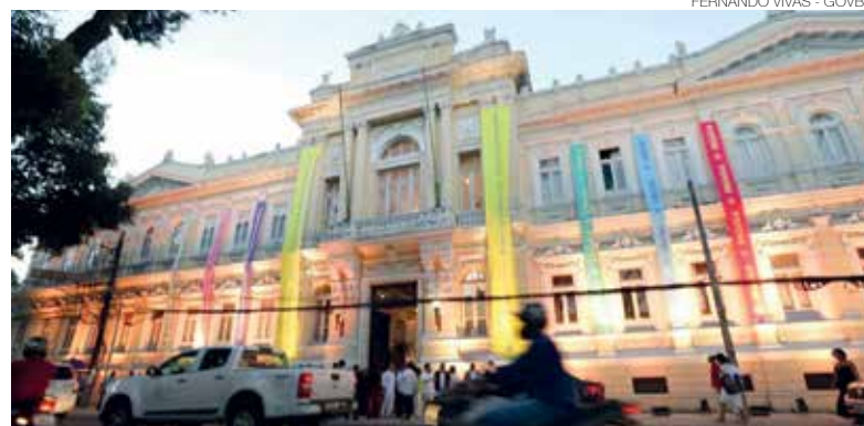
Centro Cultural Banco do Brasil: no Palácio da Aclamação, Campo Grande

moção da arte como patrimônio acessível a todos. Ao escolher Salvador para receber o novo