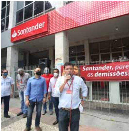
Santander: Sindicato na denúncia dos abusos