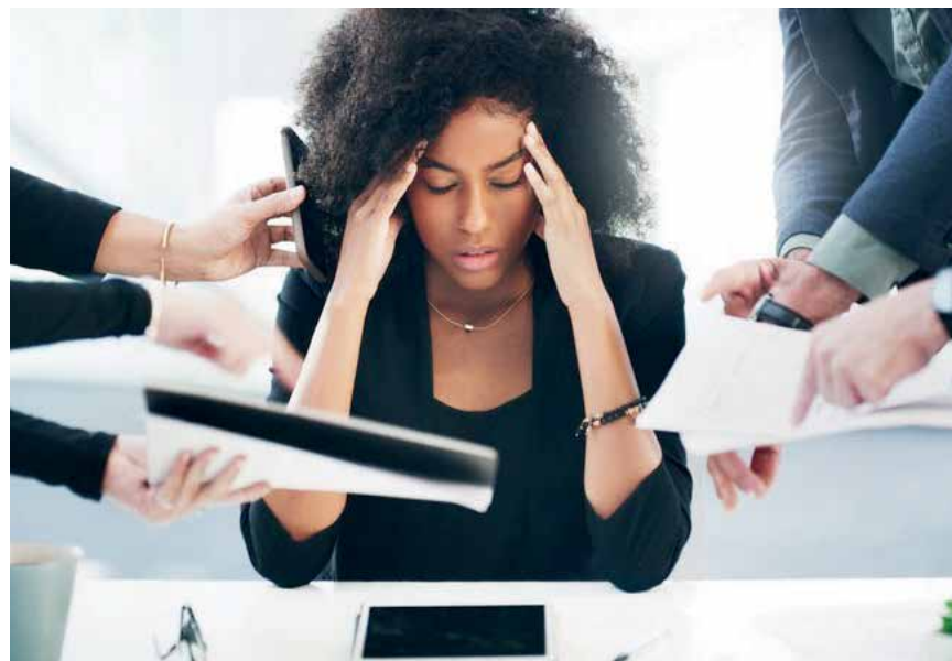
Estresse e frustração estão entre os malefícios da multitarefa no trabalho

malefícios para os trabalhadores, como estresse e frustração. Página 4