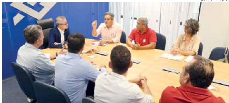
Reunião com superintendência do BB: para recuperar as funções dos caixas