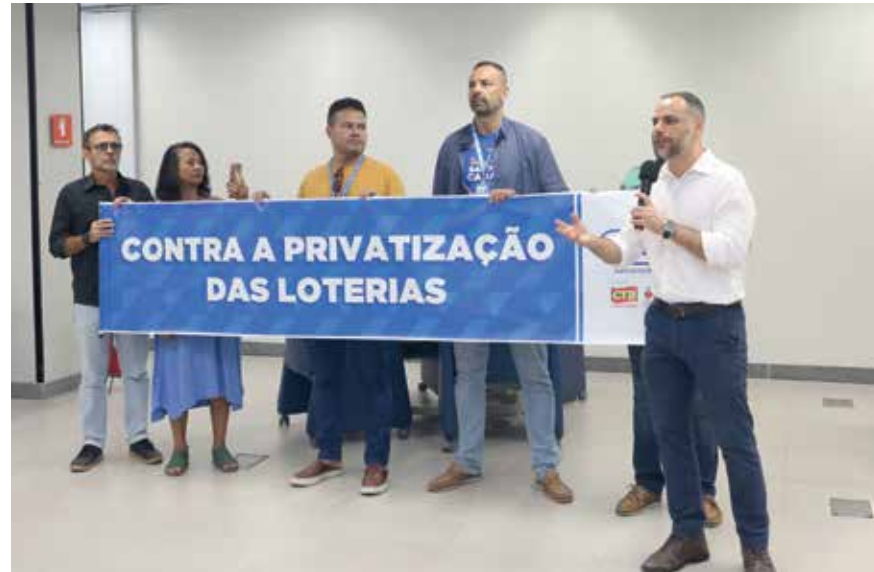
Sindicato alerta a população sobre riscos por trás da migração das Loterias

O movimento sindical ingressou com ação na Justiça para impedir que a migração se concretize. Afinal, boa parte dos recursos arrecadados pela “fezinha” dos apostadores é destinada a políticas públicas em áreas fundamentais ao combate às desigualdades.