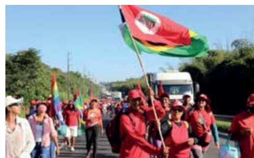
Cerca de 3 mil trabalhadores fazem a caminhada

Durante o trajeto, estão previstas atividades de solidariedade, plantio de árvores e a denúncia contra o modelo de produção do agronegócio e as violências no campo. Além disso, o MST prevê a realização de processos de formação e debates em torno da conjuntura durante os dias.