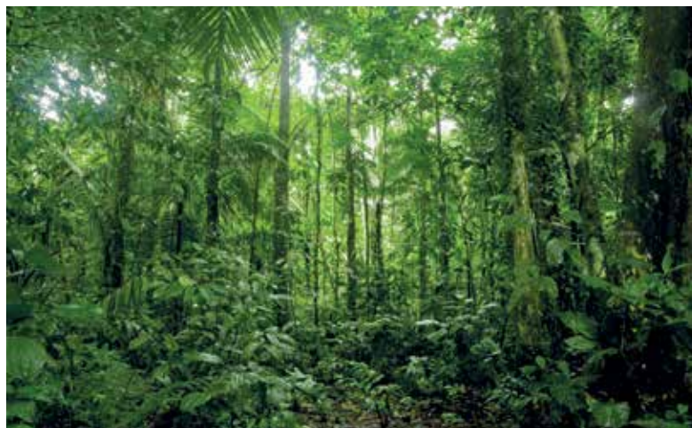
Amazônia volta a florescer com a retomada das fiscalizações, pelo governo

De acordo com a Global Forest Watch , plataforma da World