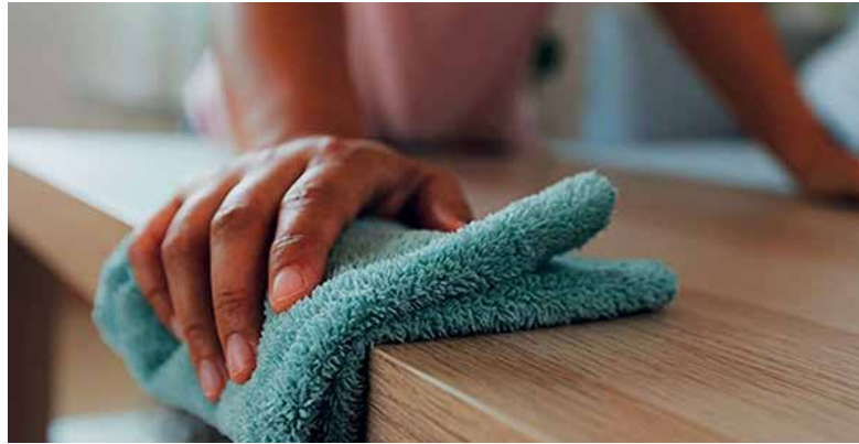
O trabalho doméstico lidera os flagrantes de escravidão no Brasil atual

O RETORNO da fiscalização de trabalho escravo no Brasil flagra mais empresas que submetem os trabalhadores a condições precárias. Mais 248 empregadores foram incluídos na lista suja, que agora conta com 654 nomes. Um recorde.