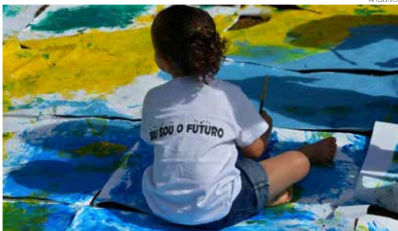
Governo Lula volta o olhar às crianças do ensino infantil. Futuro agradece