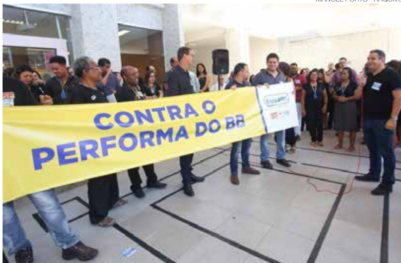
Funcionários do BB acumulam problemas por conta do programa Performa