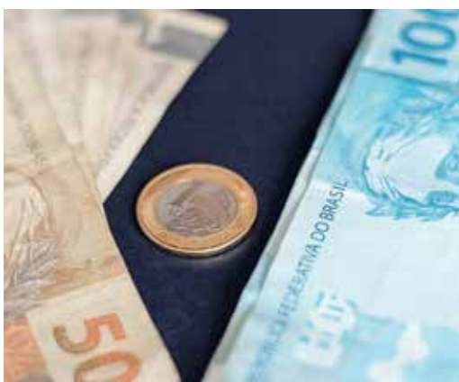
Governo estuda alterações no teto do consignado